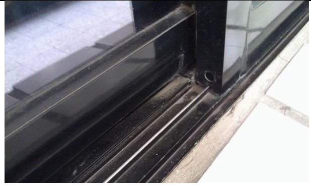
鋁窗軌道過淺，易脫落