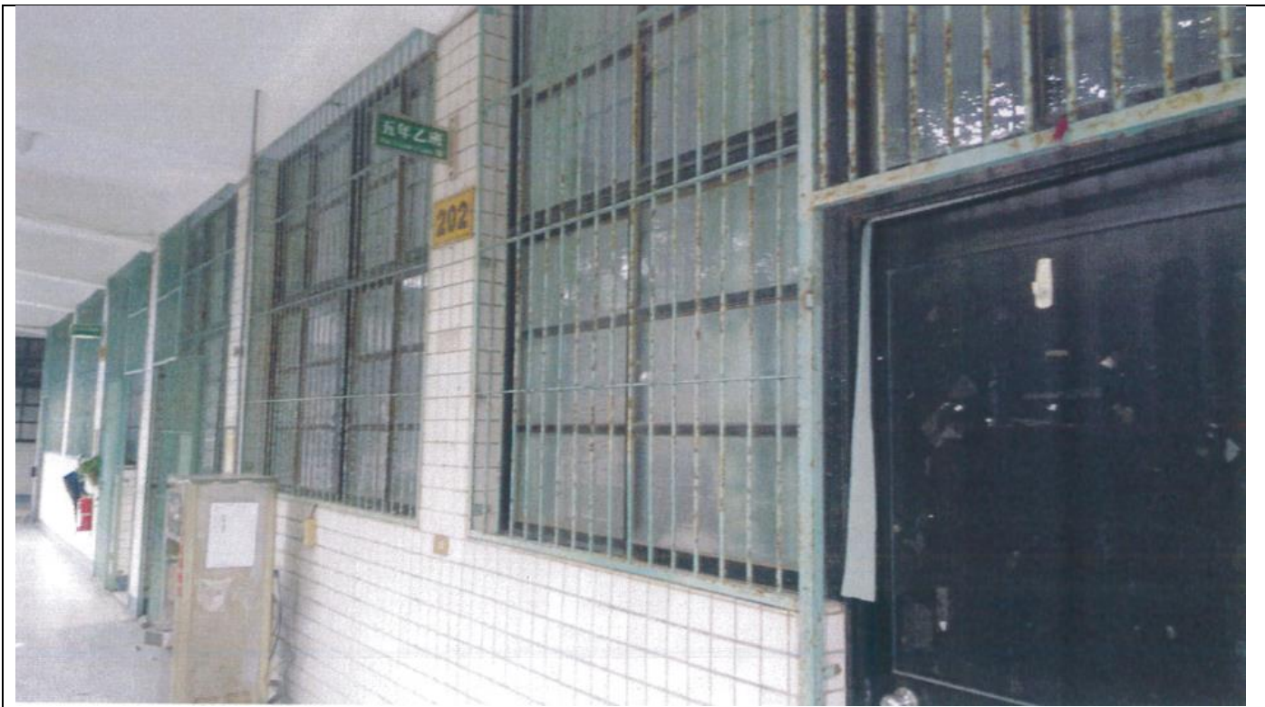
說明：改善前-舊式鐵窗影響門窗開關