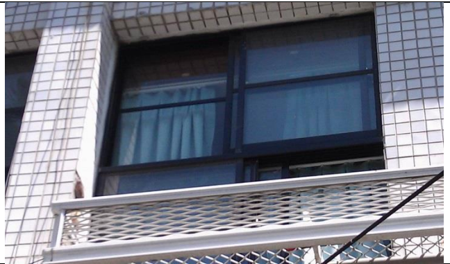
2樓鋁窗與地面落差大，若掉落易造成校園安全上的顧慮