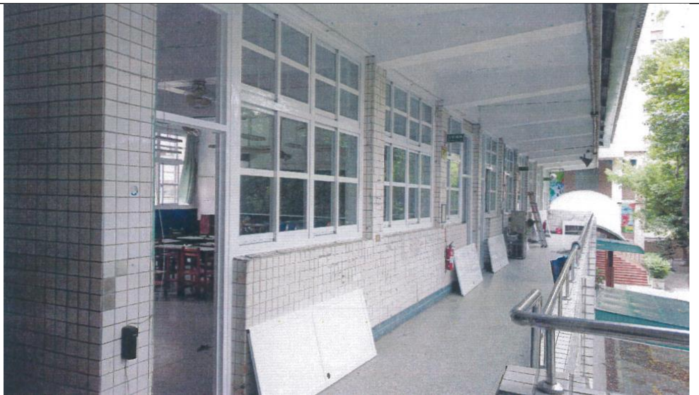
說明：改善後-拆除舊式鐵窗，以利新鋁門窗開關