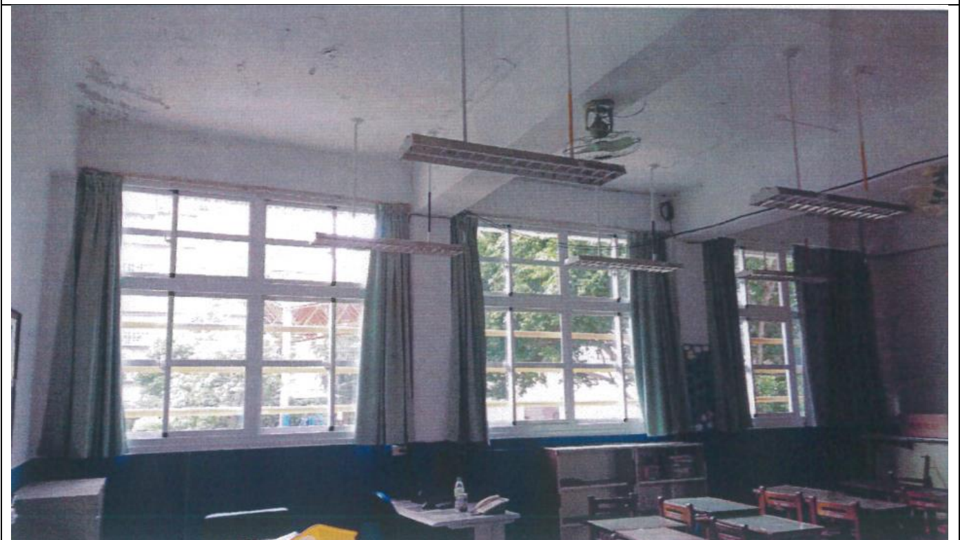
說明：改善後-更新為白色鋁門窗，提供安全明亮學習環境