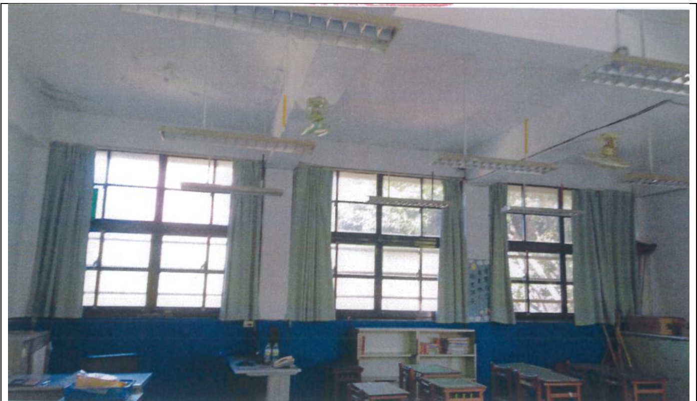
說明：改善前-門窗過於老舊，造成門框變形易脫落