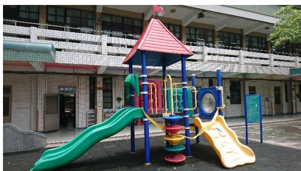
遊具過小，不敷使用 且無符合CNS合格標章