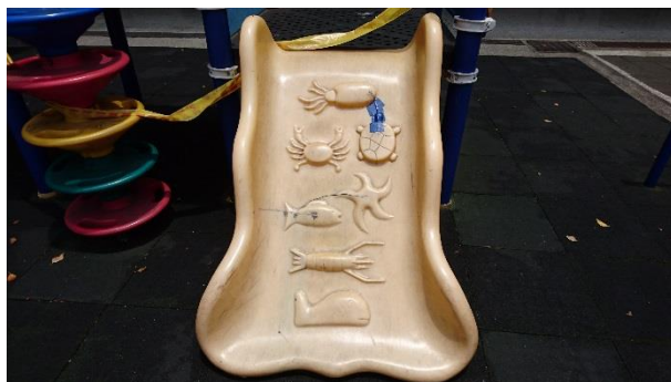
攀爬梯破損，易夾傷學童