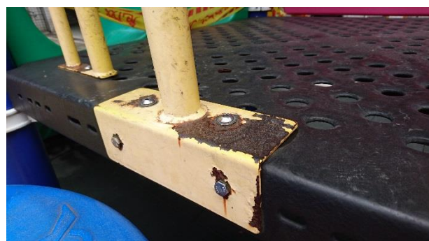
遊具多處鏽蝕，影響使用安全