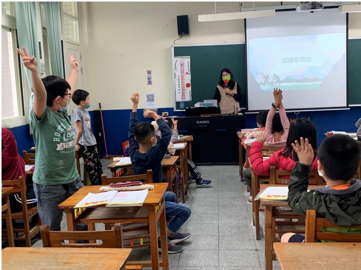
活動照片： 泰雅族介紹