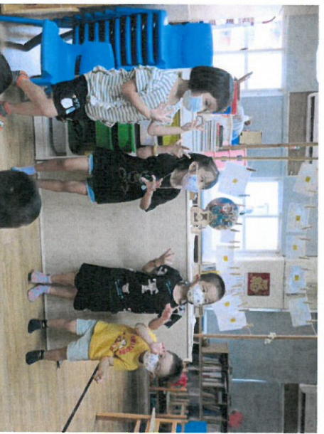
*說明：跟著母語兒歌做動作