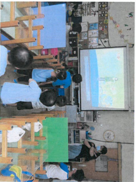
*說明：播放影片學習母語兒歌