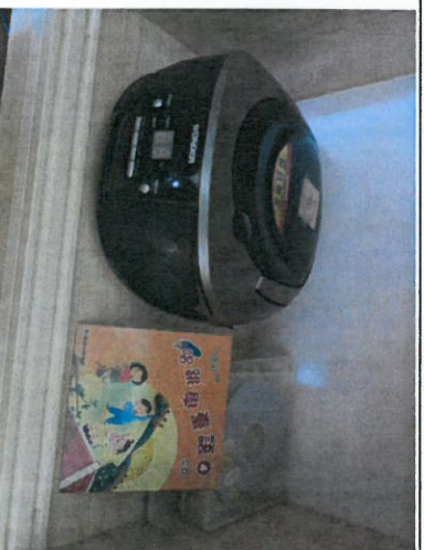
*說明：放置 CD 讓幼生聆聽閩南語