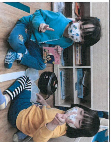
*說明：在語文區聆聽閩南語 CD