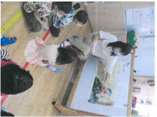
*說明：老師利用海報上的圖片講解