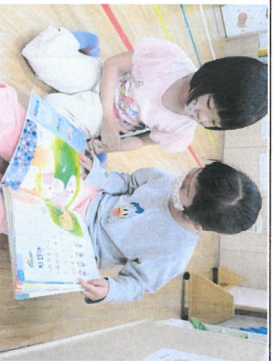
*說明：觀看閩南語讀本