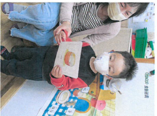
*說明：拿字卡用閩南語說『碗』