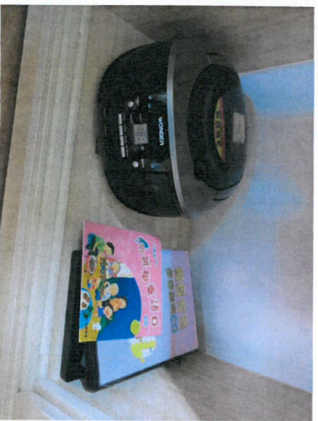
*說明：語文區放置母語兒歌 CD