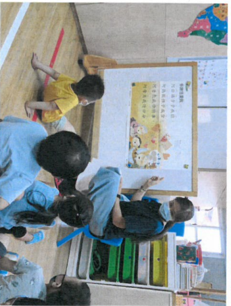
*說明：用海報的方式教學母語