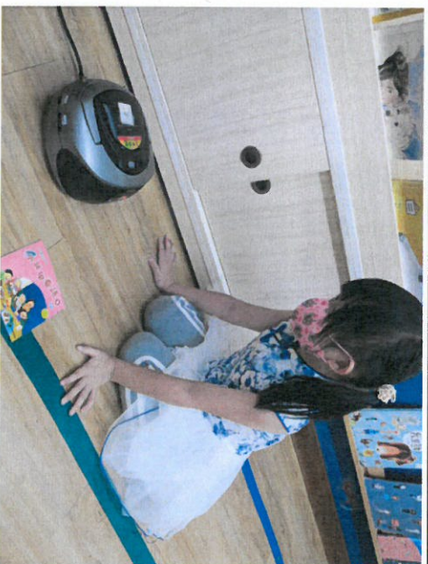
*說明：在語文區聆聽台語兒歌